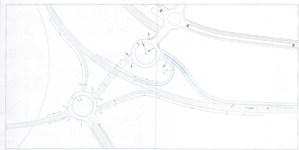
DETALLE A MODIFICADO