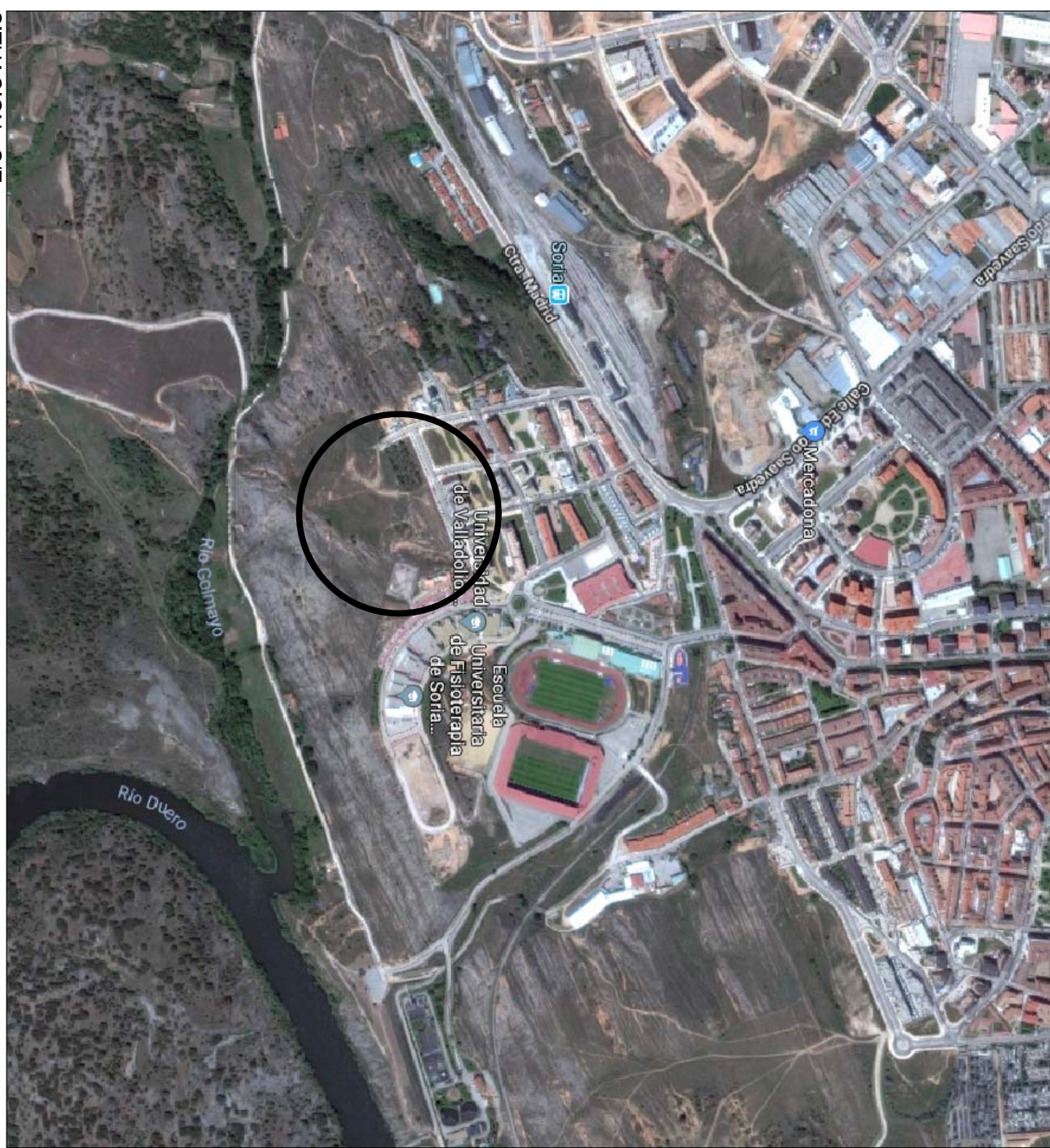
SITUACION - S/E