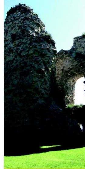
Ruta 4: De Márgenes al Vivero pasando por el Castillo