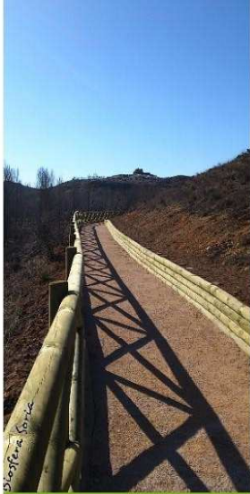
Ruta 2: Senda del Mirón a San Saturio