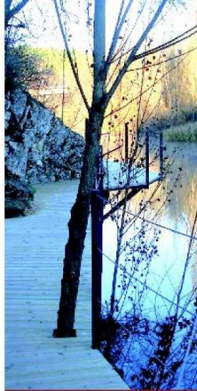
Ruta 3: Senda Márgenes hasta Garray (Solo ida)